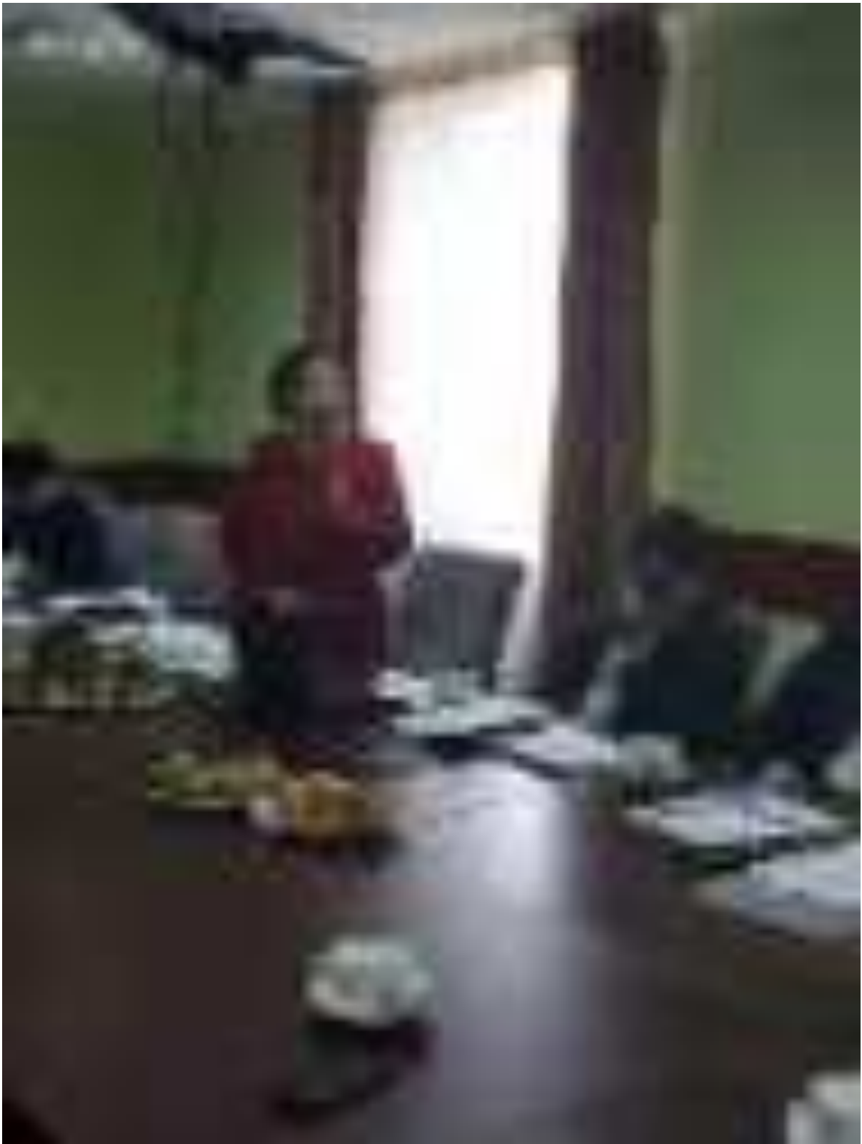
Тұңғыш президент күніне арналған салтанатты шара.