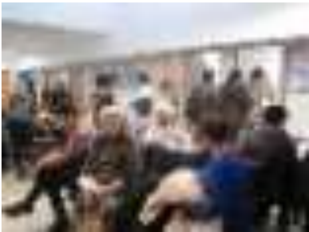
Халықаралық темекіден бас тарту күні.