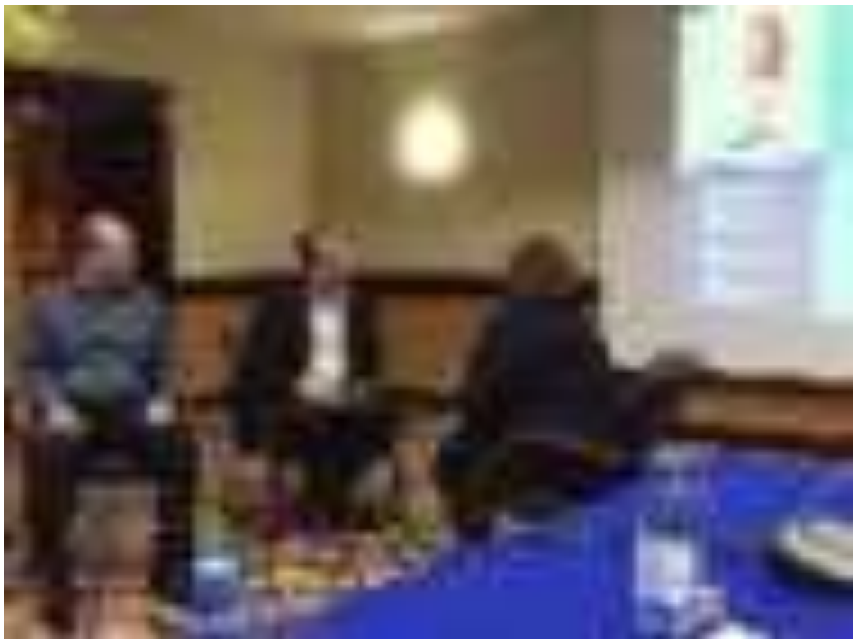
Дүниежүзілік житс-пен күрес күні.